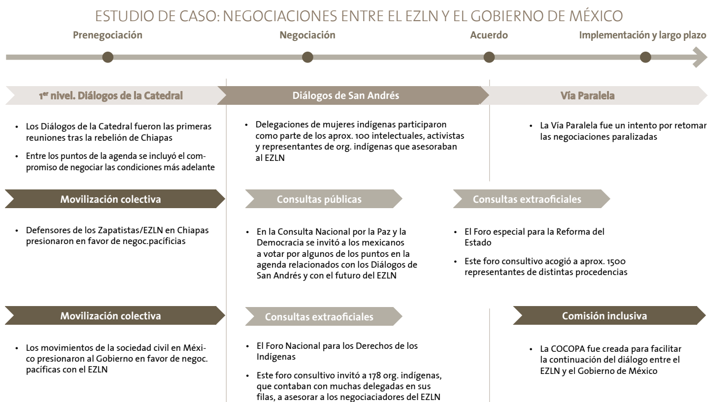
FIGURA 2: Modelos de inclusión en las diferentes fases del proceso de negociación

** Cronología aproximada del caso. Las flechas representan las modalidades de inclusión en niveles aproximados de lejanía con respecto al proceso de negociación de primer nivel (en gris).